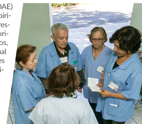
Voluntários realizam estudos coletivos periódicos

Reuniões de estudos doutrinários abertas ao público: Quartas-feiras – das 19h30 às 20h20 Domingos – das 19h às 20h30 Telefone: (31) 3115-2611