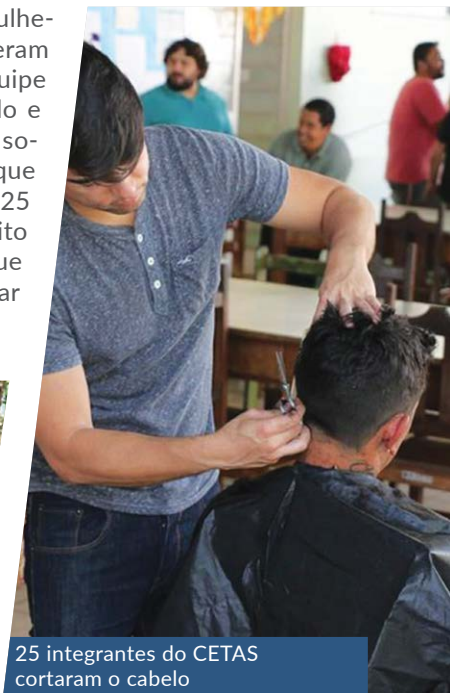
25 integrantes do CETAS cortaram o cabelo